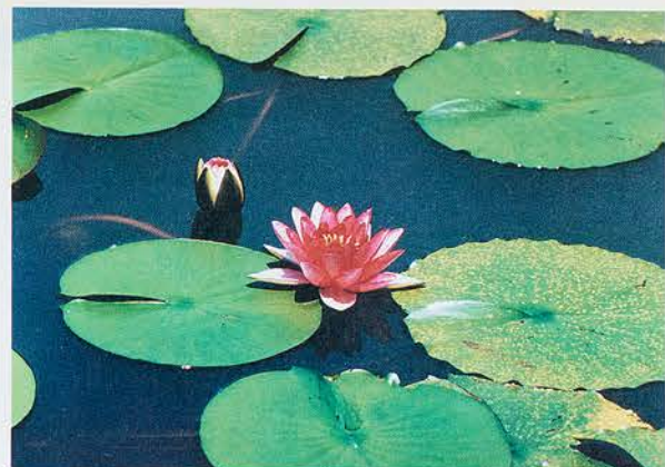
波多 悌 様