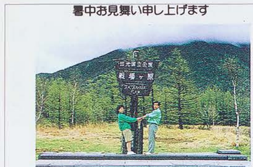
暑中お見舞い申し上げます 暑中お見舞いだけでなく、年賀状に最適です。