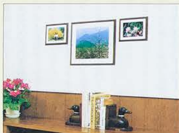
左右の写真を見比べてください。写真があると随分と雰囲気が異なります。