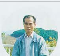
【フォトデータ】 キヤノンEOS750、 レンズ80-200mm、 シャッタースピード、 オート、フィルム・フジ HG100