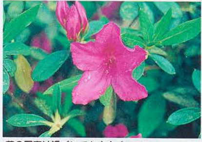
花の写真は近づいても大きく撮れるカメラを使用しております。