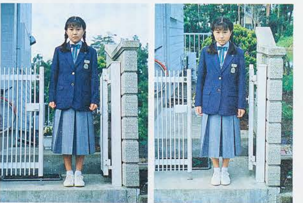
逆にカメラを低い位置で構えました。背が高く感じます。カメラを高い位置から撮影。背が低く感じます。