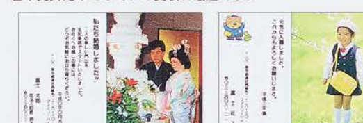
ハガキの縦使いなど種類もいろいろ

写真をハガキにする、ハガキを写真にする……こんなことができるのはご存知か。郵便局で販売している官製ハガキや文房具店・ファンシーグッズ店などで売っている切手を貼って出す私製ハガキを、写真にするものである。勿論、冬のお年玉、年賀ハガキも同じことである。これ、すなわちポストカードである。年賀状などで、このポストカードを買った人も最近では多くなっている。我がDr.キタムラ家でも時々使っているが、以前、人様から戴いたおりに家内が送ってくれた人。「この人は昔から器用だったからこんなにはしゃれたことができるのだわ。貴方は無器用だから絶対にできないわね」といってやった。ワシはシヤクにさわったので、すぐにポストカードを研究したのだが、簡単に作るのは難しいことは何もないので、この写真を送りたい」と