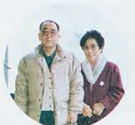
【フォトデータ】 ミノルタα7700i、 レンズAF50mmマクロ、 絞りF2.8、シャッター スピード1/125秒、 フィルム・フジHG100