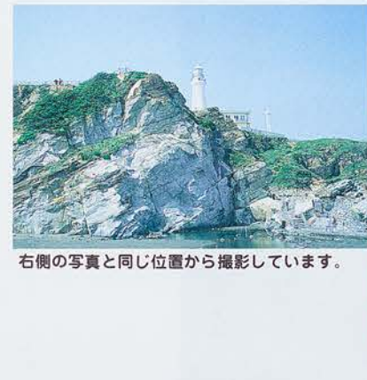
遠くを大きく写してあります。