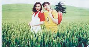
左側の通常サイズと下のパノラマを比較してみてください。グーと面白さが違ってきます。

パノラマ写真は楽しい、面白いが定評となつて人気急上昇中。まず今までに使ったことがあるお客さんに聞いてみました。 「あまり期待しないで使ったけど、できあがってビックリ。また使います」「旅行写真を友人に見せたら行った気になつたと、とても喜んでくれた」「使ったよかったです、いい思い出ができました」「この写真の楽しさやミツキになりそう」 横に長い、縦に長いパノラマ写真。誰にでも撮影できます。長く美しく続く山並みを撮ろうとしても通常