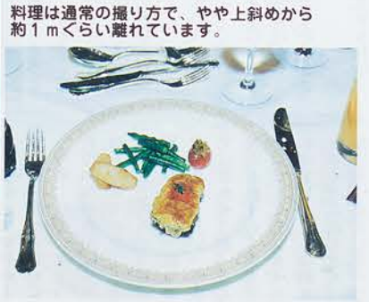
料理は通常の撮り方で、やや上斜めから約1mくらい離れています。

これから夏に向かつて、ダイバー・サーファーが活躍する時期である。最近では「写ルンです」の防水用が発売されるなど、防水関係が充実してきて、海、川での撮影が増えてきている。こうした防水関係は特殊なものではなく、浜辺で撮影するのにも持つてこいである。カメラの防水用ケースも販売されており、誰でも使うことができる。ただし、フィルムを入れ換えた後、濡れた手で扱わないで下さい。